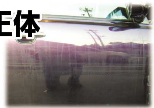
白い車だけでなく、濃色車にも「水垢」は付着する

車には埃や泥以外にも色々な汚れが付きます。洗っても取れないものもあり、特に雨が降り多い梅雨の時期には「水垢」「水シミ」「雨ジミ」がキレイ好きな愛車家を悩ませます。「水垢」が発生する原因と対策手段を紹介します。