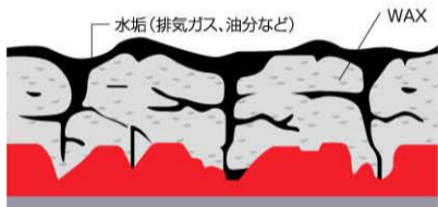
WAXに汚れが溶け込んで「水垢」になる