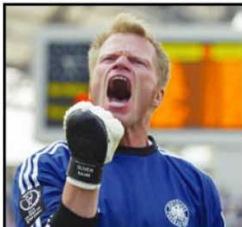
オリバー・カーンの時代

濃色車に特に目立つ「白い輪状のシミ」あるいは「うろこ状の輪」は、水垢ではありません。水の中に含まれたミネラルが、水が乾いた後に析出して白く輪状に付いたものです。ミネラルは黄砂などが空中にある場合は雨水にも含まれていますが、主に水道水が原因です。水道水を車を洗ったあと拭き上げずに置いておくと付いてしまいます。今流行のガラスボディコーティング施工車は、表面が無機物のガラスで覆われているために「水シミ」「雨ジミ」が付きやすく、ひどくなると頑固な固着物になって並大抵のことで除去できなくなります。この問題を根本的に解決したのがダイヤモンドキーパーハイブリッドで、一切の「水シミ」「雨ジミ」から開放されます(特許公開中)。