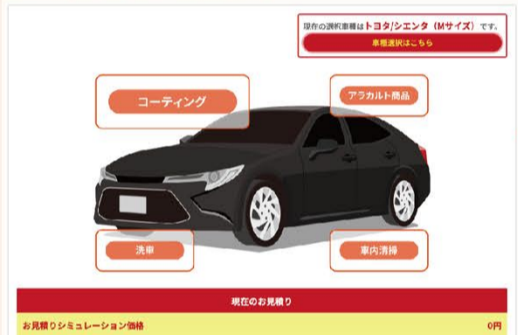
【お見積りシミュレーション画面】