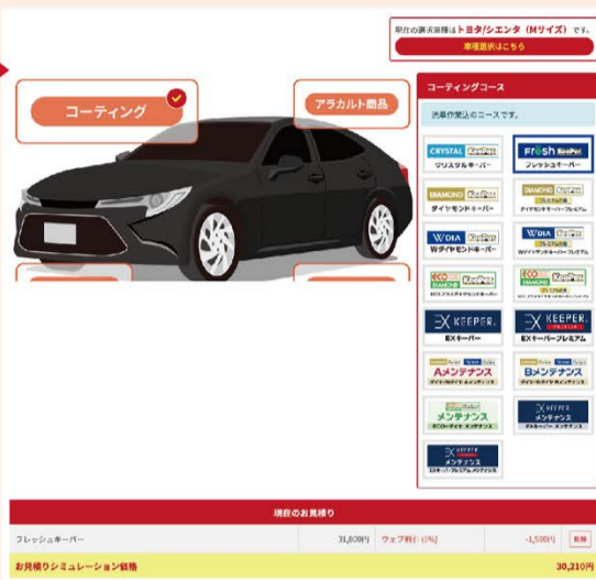
【お見積りシミュレーション画面】

11月16日より、KeePer LABOのWebサイトで「お見積りシミュレーション」を新たに開設。お客様ご自身で車種やメニューを選ぶことで、施工価格がわかるコンテンツです。