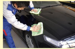
キーパークロスで一気に水分を拭き取ろう