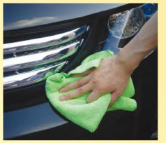
細かいところに残った水分もきちんと拭き上げよう