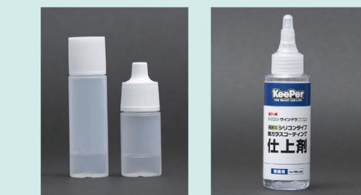
右が「主剤」、左が「硬化剤」 仕上剤