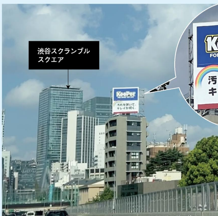
渋谷スクランブルスクエア