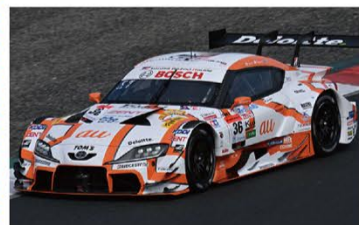
GT500 36号車/ au TOM'S GR Supra

今回、新しい愛車として納車されたトヨタヴェルファイアに、EXキーパープレミアムを施工していただきました。施工していただいた愛車は見える部分だけではなく、ドアを開けたところまで艶々にコーティングされていて新車が新車以上の輝きになり、とても嬉しいです。毎日車での移動が多いですが、愛車が汚れにくくなりいつも綺麗な状態でいられることも助かっています。Rd.4富士大会で今シーズン初表彰台を獲得しました。次は初優勝を目指して大湯選手と立川監督と力を合わせて頑張りますので、ぜひシーズン後半戦も応援をよろしくをお願いします!