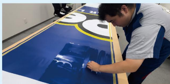
コーティング施工中