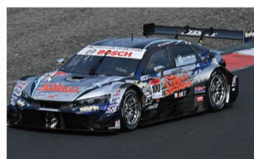
GT500 100号車/ STANLEY CIVIC TYPE R-GT