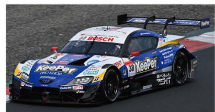
GT500 38号車/KeePer CERUMO GR Supra

新型ランドクルーザー250にキーパーコーティングをするとう仕上がるのかをご覧いただきながら、「EXキーパープレミアム」の特徴を知っていただける内容です。