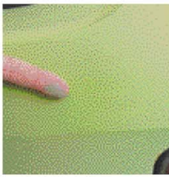
劣化した塗装が粉化したボディ。触ると分解された塗装の成分である樹脂や顔料が指などにつついてしまいます。こうなると磨いてもツヤは戻りません。