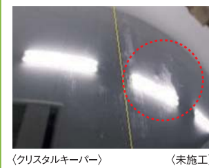
〈クリスタルキーパー〉 〈未施工〉

クリスタルキーパーの施工車は、水や熱が同条件であっても白い跡が相当つきづらくなることがテストで証明されています。