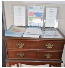
アンティークな家具の上に飾られたコーティング技術認定証とパンフレット類

私と妻と娘の車3台とも、クリスタルキーパーをお願いしています。今日は妻の車の3回目、新車時から1年ごとにきっちりコーティングしているのでツヤも良く汚れにくい。私の車(プリウス・黒)も、もうすぐ3回目の施工です。「黒い車は手入れが大変だよ」と聞いたのですが、新車の時と変わらなくらい輝いています。普段の洗車も含め、メンテナンスはすべてこのお店にお任せしています。特に言わなくても、雪道を走った後は下回りを重点的に洗ってくれたり、部分的にコーティングの手直しをしてくれたり、細かなところまで気配りしてくれるから安心です。「コーティング技術者」の方がちゃんといろしゃるんですね!こういうきっちりとした技術資格を持った人が、全国にもっと増えるといいですね。