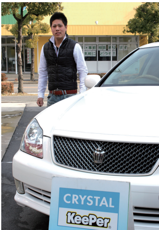
ご両親が乗っていたクラウンに影響されて中古車を購入。セダンの乗り心地が好きなのだそう。

クリスタルキーパーは独自の無機質ガラスを塗装面上に形成して、保護能力の高いベース被膜を作ります。さらにベース被膜の上を最新のレジ被膜でさらにガード!二層構造でより深いツヤと撥水性・耐久性を保つんです!