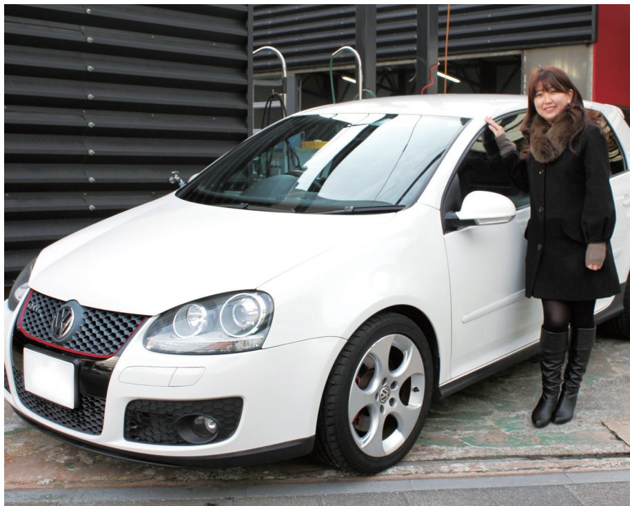
旦那様が2年前に中古車で購入。スポーツカーが好きだったのですが、結婚して2人で乗ることを考えてゴルフに。たまに自分で洗車をしているそう。

以前、自分の両親のクルマを自分で洗車したことがあるんですが、濃紺の塗装だったのもあったのか、細かいキズがいっぱいついてしまって焦ったことがありました(笑)。両親へのプレゼントにしたらきっと喜んでくれそうです!