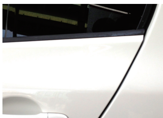
スッキリキレイに消えました!