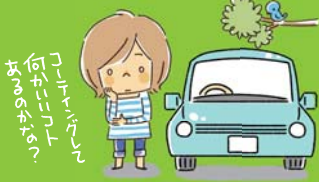
アイコさん(31歳・主婦) 車種:軽自動車 乗車歴:3ヶ月 洗車:たま〜に自宅で洗車 性格:スポラ、のーてんき