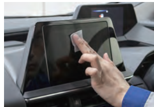
内窓クリーナー・ マイクロファイバークロス