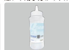
爆ツヤ用小分けボトル